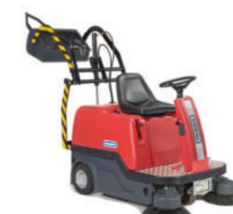
KS 1100 BHD